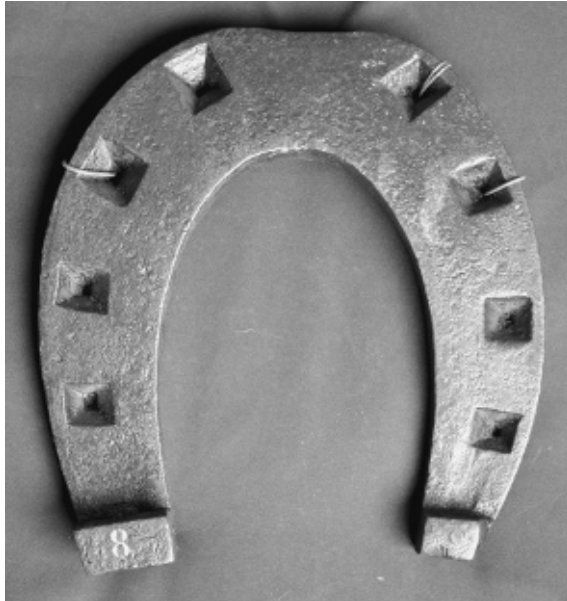
Figure 1 : Fer à l'allemande; musée Fragonard, École nationale vétérinaire d'Alfort.

Les chevaux de travail étaient pourvus d'une ferrure très lourde, qualifiée de « ferrure à l'allemande ». Son épaisseur lui permettait de résister à l'usure en pince – la partie antérieure, médiane, du fer – et en mamelle 11 externe, ce qui garantissait une longue utilisation tout en favorisant l'adhérence du pied via des crampons en talons susceptibles de pénétrer profondément dans la terre (Figure 1).