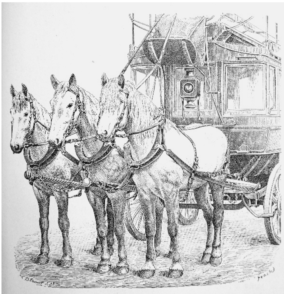
Figure 5 : Attelage d'un omnibus à trois chevaux avec colliers métalliques, Edmond Lavallard, Le cheval dans ses rapports dans l'économie rurale et les industries de transport , Tome 2, Firmin-Didot, Paris, 1894, p. 181.