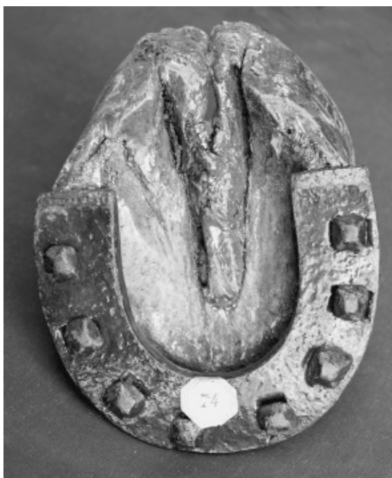
Figure 2 : Fer Lafosse à croissant, musée Fragonard, École nationale vétérinaire d'Alfort.