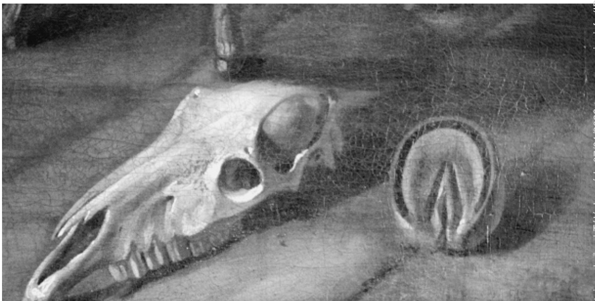
Figure 3 : Fer Lafosse enclavé, détail d'Une leçon d'anatomie chez Lafosse, École française, XVIII e siècle, collections de l'École nationale vétérinaire d'Alfort.