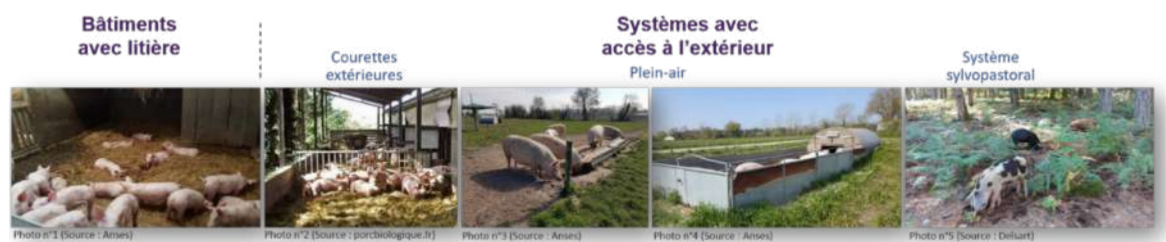
Figure 1 : Diversité des modèles d'élevages alternatifs de porcs.